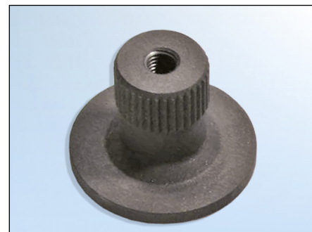
Obrázek 2: Adaptér 30648510

Upevňovací šrouby utahujte výrobcem vozidla předepsaným utahovacím momentem!