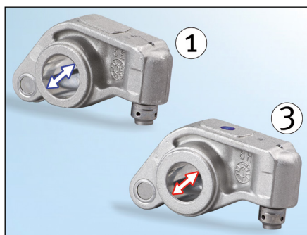
Obrázek 2: Vahadlo sání (1) má větší průměr

Při montáži je nutné dbát na správné přiřazení. Rozdíly lze zjistit jednak díky různému průměru otvorů pro hřídel vahadla ( obrázek 2 ) a také díky jinému zalomení vahadla ( obrázek 3 ).