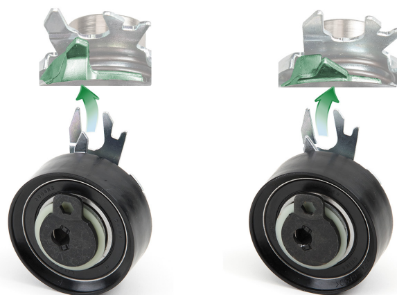
Obrázek 1: Vlevo - napínací kladka 531 0252 30, vpravo - napínací kladka 531 0525 30

U napínacích kladek 531 0252 30 a 531 0525 30 vzniká nebezpečí jejich vzájemné záměny. Nejen, že jsou velmi podobná jejich objednávací čísla, ale téměř žádné rozdíly nevykazují také vizuálně. Odlišný je pouze ukazatel obou napínacích kladek a jeho umístění (obrázek 1).