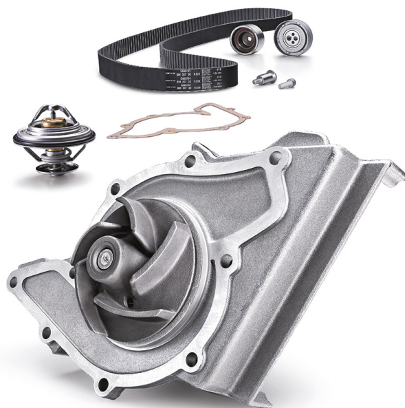
Obrázek 2: Sada čerpadla chladicí kapaliny s papírovým těsněním

Před montáží nového čerpadla chladicí kapaliny je nutné pro přípravu a očištění těsnicích ploch použít škrabák nebo leštící kotouč.