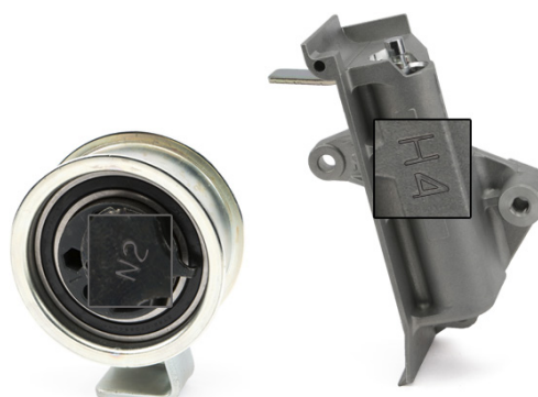
Obrázek 2: Napínací kladka 531 0436 20 s tlumičem vibrací 533 0035 10