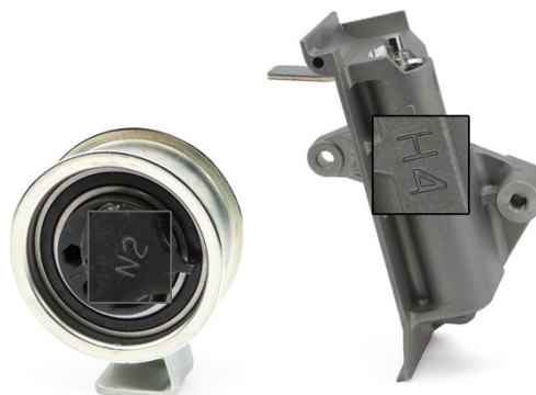
Obrázek 2: Napínací kladka 531 0436 20 s tlumičem vibrací 533 0035 10