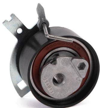
Obrázek 1: Napínací kladka 531 0810 10

Obě provedení splňují technické specifikace a lze je tedy používat bez omezení. V přechodové fázi mohou být k dispozici smíšené zásoby obou provedení.