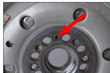
Obrázek 2: poziční vrtání na dvoumotovém setrvačnicku (na straně k motoru)

Tento typ dvoumotového setrvačnicku lze namontovat v různých polohách, ale pouze jedna je správná!