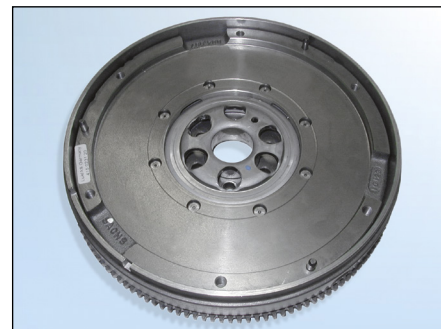
Obrázek 3: Sachs-ZMS