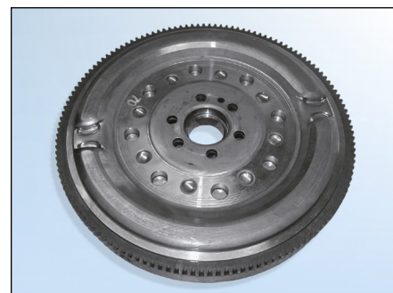
Obrázek 4: Sachs-ZMS

Aby byla při výměně spojky (bez výměny setrvačníku) přiřazena správná spojka, je nutné identifikovat typ setrvačníku, který je namontován.