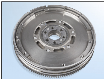
Obrázek 1: LuK-ZMS

Výrobci: Audi, Škoda, VW Modely: Audi: A4/Avant (8E2, B6, 8E5, B6) Škoda: Superb (3U4) VW: Passat (3B3, 3B6) Motor: 1.9 TDI Objednací č.: 415 0231 10 (ZMS) 623 3092 00 (RepSet) 623 3092 10 (RepSet) 600 0015 00 (RepSet DMF)