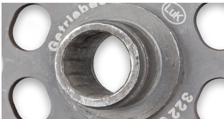
Obrázek 2: Poškozený profil náboje

Pokud jsou v dodávce dílů při výměně spojky nebo DMF přiloženy nové upínací šrouby, musí se vždy použít. Pokud v dodávce dílů nejsou šrouby přiloženy, je nutné použít výhradně šrouby velikosti M6x13 ve třídě pevnosti 10.9.