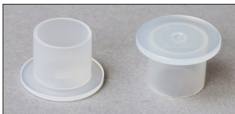
Obrázek 2: Uzavírací zátka

Aby se zamezilo ztrátě oleje při demontáži převodovky, jsou ke každému LuK ZMS popř. LuK RepSet®2CT přiloženy dvě uzavírací zátky. Ty se musí ve vestavěném stavu převodovky namontovat místo černých odvzdušňovacích krytek Mechatronik a převodovky (viz obrázek 1). Po montáži se musí obě uzavírací zátky demontovat a znovu se musí namontovat odvzdušňovací krytky.